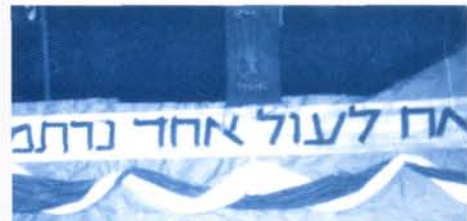
בליל שבת חגגנו על הדשא מאחורי המרפאה את חג המחזור הראשון