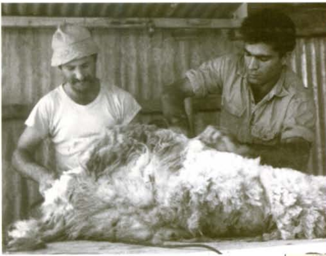
יצחק ד' וגדעל'ה החלו היום בגז הצאן בדיר