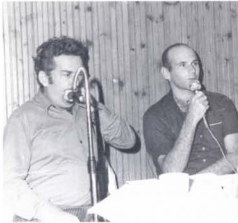
במסיבה גדולה בחדר האוכל קיבלנו את פני שבויינו שחזרו ממצרים.