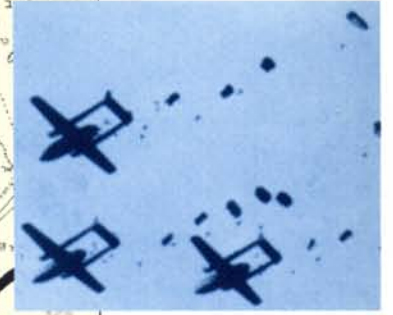
ביום ד' נשמנו לרווחה, עם כל המדינה כשטוסים של צה"ל הצניחו צנחנים בחצי האי סיני