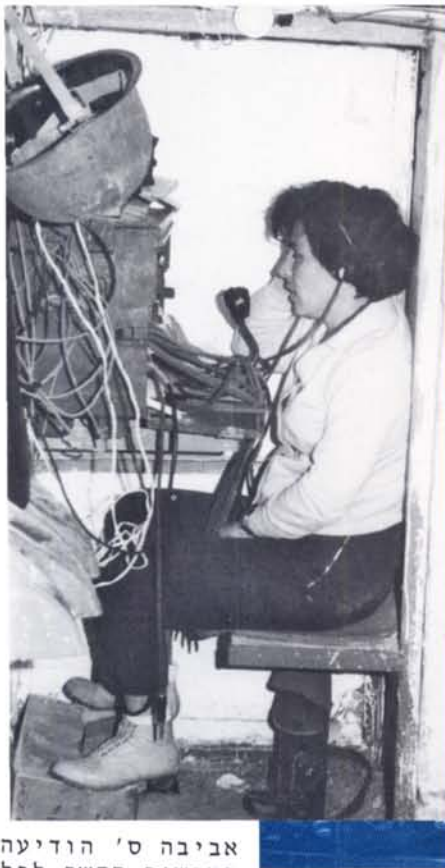
אביבה ס' הודיעה במכשיר הקשר לכל החברים על כיבוש הרצועה במלחמת ששת הימים