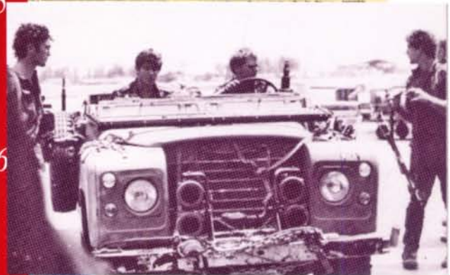
במבצע חילוץ גדול שחררו חיילי צ.ה.ל. את בני הערובה מידו החוטפים ובני בריתם האיוגנדים באנטבה.